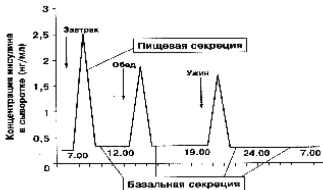
Рис. 1. Физиологическая секреция инсулина

В силу вышеперечисленных причин, при лечении больных СД смоделировать близкие к физиологическим соотношения уровней гликемии и инсулиемии по всем параметрам довольно сложно. Кроме того, фармакокинетика современных препаратов инсулина значительно отличается от кинетики эндогенного инсулина. В то же время только адекватная инсулинотерапия может предотвратить развитие сосудистых осложнений СД. При этом идеальным состоянием инсулинотерапии является максимальное соответствие уровня экзогенно вводимого гормона потребностям организма в инсулине в каждый отрезок времени. Наиболее полно восполняет данную физиологическую особенность базис-болюсный режим инсулинотерапии, где в базисном режиме вводится инсулин пролонгированного действия, который поддерживает нормальный уровень глюкозы в крови на протяжении суток и в болюсном режиме вводится инсулин короткого действия (перед тремя основными приемами пищи) для нивелирования гипергликемии на фоне приема пищи [ 1, 6, 12].