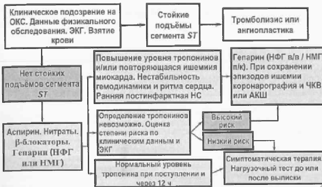
Рис. 3. Тактика лечения больных с ОКС

минут дозу увеличивают на 10 мкг/мин, не допуская снижения АД менее 100 мм рт. ст. Инфузия нитропрепаратов проводится 1-2 суток.