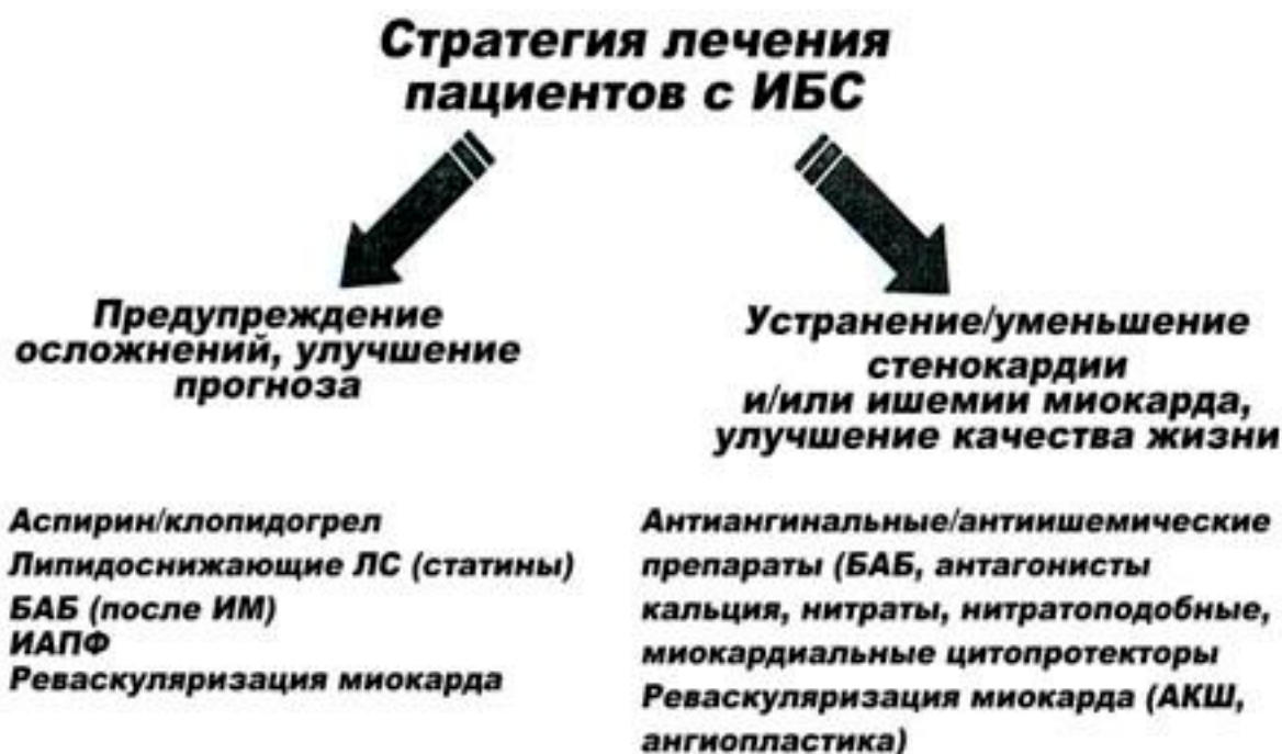
Рисунок 1. Стратегия лечения пациентов с ишемической болезнью сердца (ИБС). ЛС- лекарственные средства; БАБ – бета-адреноблокаторы; ИАПФ - ингибиторы ангиотензинпревращающего фермента

Первое - это назначение базовой терапии, улучшающей прогноз, и второе - терапия, направленная на улучшение качества жизни, устранение приступов стенокардии и ишемии миокарда. Оба эти направления являются равнозначными и обоим направлениям должно быть уделено большое внимание.