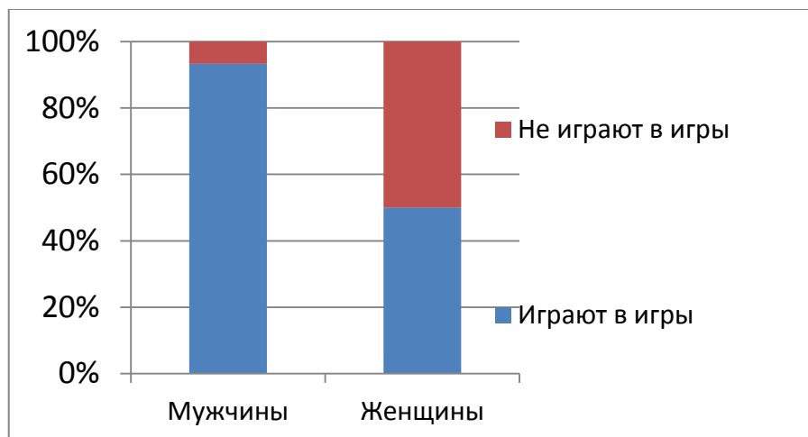
Рис. 1. Распределение геймеров по полу

тересом к себе, гибкостью установок. Остальные жанры несут скорее эффект гиперкомпенсации реальных проблем или самореализацию без критики в виртуальном мире.