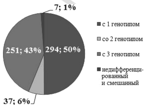
Рис. 1. Распределение пациентов по генотипам ВГС

У 152 пациентов (26%) терапия ХВГС проводилась с применением «стандартных» ИФН и РБВ, у 437 (74%) – ПЕГ-ИФН и РБВ.