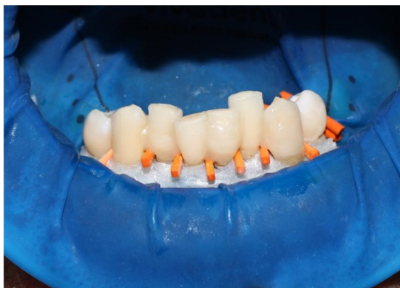
Рисунок 1 – Шинирование зубов по вантовой методике (вид с вестибулярной стороны)

Материал и методы. После проведения подготовительного этапа и достижения уровня гигиены полости рта (ОНИ-S) менее 0,6 проведена иммобилизация подвижных нижних фронтальных зубов у 14 пациента в возрасте 35-54 лет с хроническим периодонтитом. Пациенты равномерно распределены в 2 группы. Восемью пациентам 1-й группы проведено шинирование стекловолоконной лентой по вантовой методике: по 4 шины – при II-й и III-й степени подвижности зубов (рисунки 1, 2).