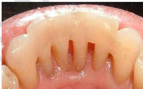
Рисунок 3 – Шинирование зубов по гусеничной методике

Шести пациентам 2-й группы подвижные зубы шинировали по гусеничной методике: 2 шины – при II-й степени подвижности зубов и 4 шин – при III-й степени (рисунок 3).