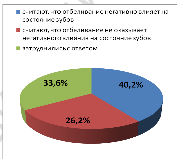
Рисунок 2 – Распределение респондентов по применению для гигиенического ухода зубных паст, обещающих «отбеливание зубов»

трети респондентов – 70,4% (226 человек) – применяют зубные пасты, обещающие отбеливающий эффект. Это достоверно больше доли лиц, признавших недовольство цветом зубов – 34,0% (109 человек) - \chi^2=85,5 ; p<0,001 . Регулярно используют зубные пасты, заявленные как отбеливающие, 13,7% (44 человека), периодически - 56,7% (182 человека), \chi^2=91,3 ; p<0,001 . Стоит отметить, что 37% (84 человека) респондентов, использующих отбеливающие зубные пасты, остались недовольны результатом их применения. Вместе с тем, 7,2% (23 человека) респондентов не придают значения тому, какой пастой они чистят зубы (рисунок 2).