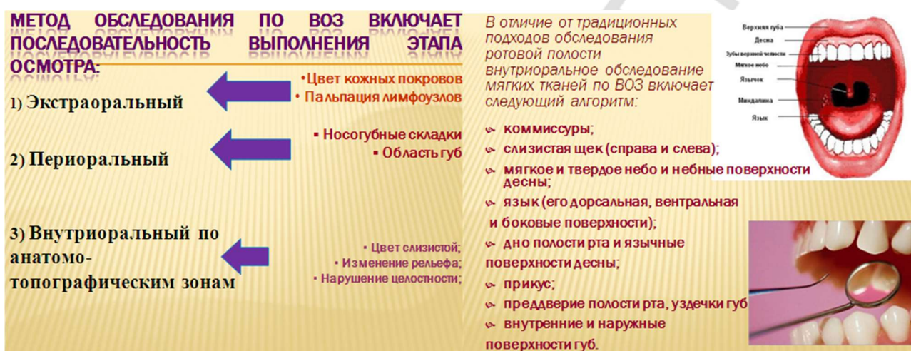
Рис. 1 Алгоритм обследования по ВОЗ

следующем этапе просят пациента сомкнуть зубы, чтобы определить прикус и охарактеризовать состояние тканей преддверия рта. Затем определяют значения показателей ОНI-S, КПИ и КПУ, характеризующих здоровье ротовой полости [2, 6]. Практическое использование метода обследования по ВОЗ позволяет не только обзорно оценить состояние всех тканей полости рта, но и выявить ранние признаки заболеваний слизистой, болезней периодонта и т.д. [2, 5]. Важно распознать патологию слизистой и провести оценку пораженных участков по таким клиническим критериям, как изменение цвета, рельефа, нарушение целостности, их локализацию и т. д. в сопоставлении с нормальными окружающими тканями [6, 7].