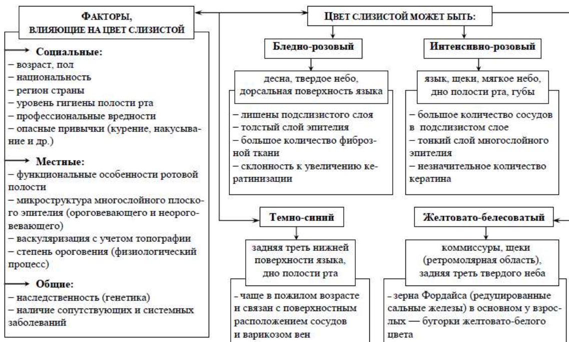
Схема 1. Цвет СОПР в норме по топографическим зонам

Таким образом, при обследовании каждого пациента на этапе осмотра, в первую очередь следует оценивать состояние мягких тканей по таким клиническим критериям, как цвет и рельеф (поверхность) слизистой оболочки полости рта и в целом ее архитектуру в норме и для распознавания патологических процессов [2, 3].