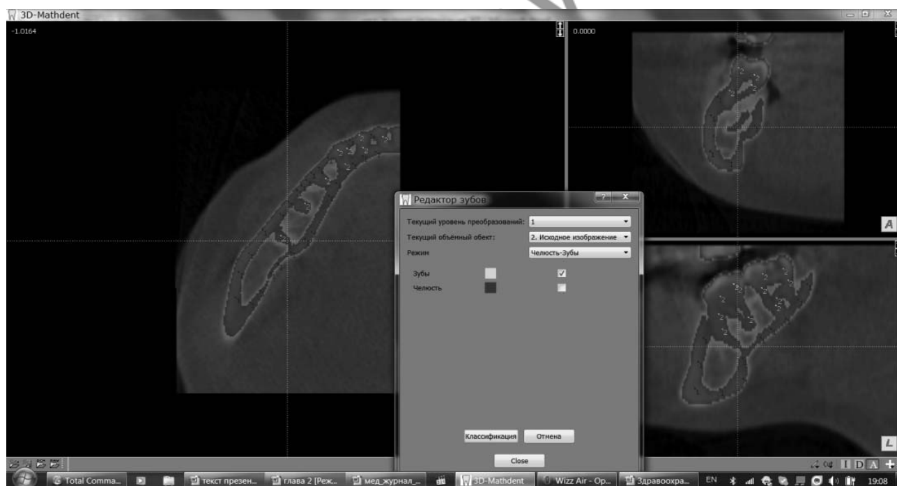
Рис. 2. Разметка маркерами соответствующих объектов (синий – челюсть, зеленый – зубы) на исходном изображения после пороговой сегментации

КЛКТ сканеры реконструируют проекции данных, обеспечивая возможность отображения информации в трех ортогональных плоскостях (аксиальной, сагитальной и корональной). Так как реконструкция данных КЛКТ осуществляется изначально с помощью персонального компьютера, то благодаря переориентации данных можно изменять визуализацию анатомических структур пациента [1, 2, 5, 12]. В стандартный набор функций просмотра обычно входят изменения масштаба, яркости, переход между окнами, интерактивные возможности линейных и угловых измерений без искажений. Работа с плоскими (2D) изображениями в КТ-сканерах чаще всего реализуется в режиме мультипланарной реконструкции, которая представляет собой окна, отображающие срезы