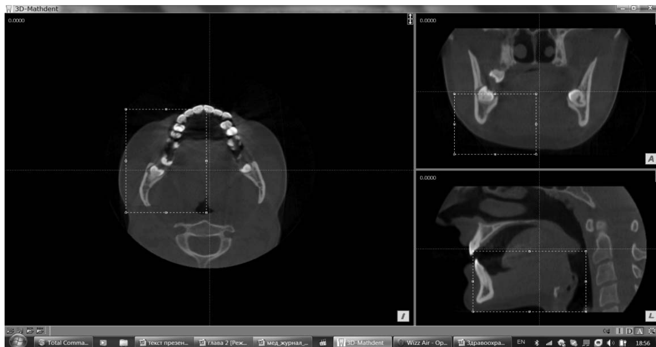
Рис. 1. Выделение зоны интереса для трехмерной реконструкции на исходном изображении