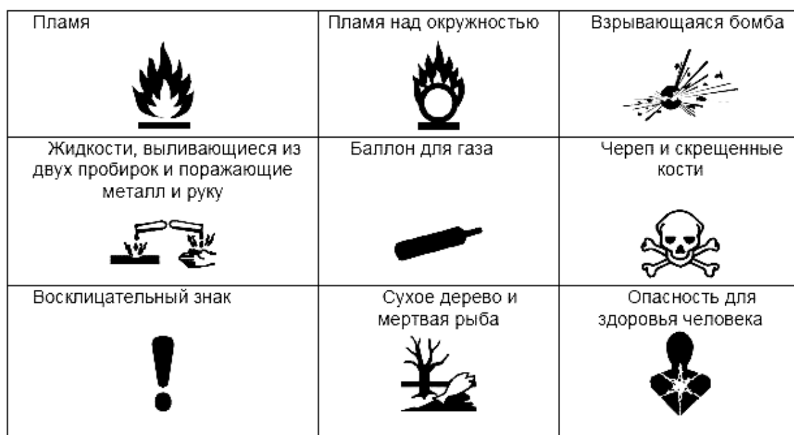
Рис. 2. Символы опасности

– Н361 — предполагается, что данное вещество может отрицательно повлиять на способность к деторождению или на неродившегося ребенка.