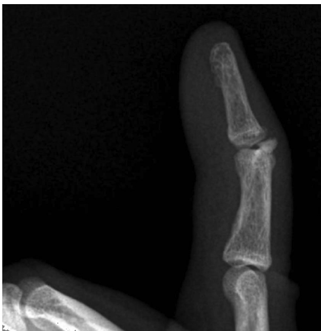
Рисунок 1. Рентгенограмма пациента Н., до оперативного вмешательства