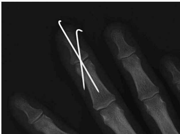
Рисунок 4. Рентгенограмма пациента З., после остеосинтеза отломков и выполнения «временного артродеза» дистального межфалангового сустава второй спицей (прямая проекция)