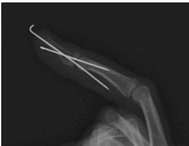
Рисунок 5. Рентгенограмма пациента З., после остеосинтеза отломков и выполнения «временного артродеза» дистального межфалангового сустава второй спицей (профильная проекция)

Этап выполнения трансартикулярной фиксации («временного артродеза») дистального межфалангового сустава пальцев кисти абсолютно необходим при хирургическом лечении рассматриваемой патологии, поскольку действию крепящегося к волярному участку основания концевой фаланги объемного и мощного сухожилия глубокого сгибателя (для большого пальца – длинного) в раннем послеоперационном периоде практически невозможно противостоять весьма деликатному участку сухожильно-апоневротического растяжения, подвергнутому чрескостной травме, открытой репозиции и различных видов фиксации костных отломков, усугубившей итак нередко имеющиеся в силу разных причин проблемы остеопороза кости. Спица, проведенная через дистальную и среднюю фаланги пальца кисти, позволяет обеспечить дополнительную стабильность костных отломков, необходимую для их полноценной консолидации и избежать избыточной ятрогенной травматизации миниатюрного тыльного