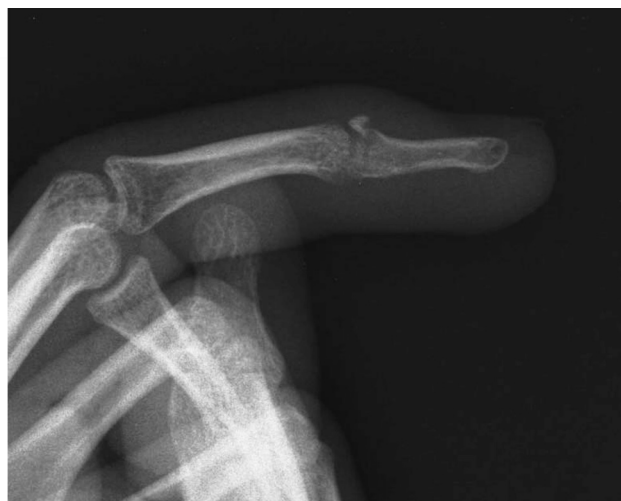
Рисунок 3. Рентгенограмма пациента О., с незначительными размерами оторванного тыльного фрагмента основания тыльной поверхности дистальной фаланги

В 29 случаях, при незначительных размерах оторванного костного фрагмента (рис. 3) тыльной поверхности основания дистальных фаланг пальцев кисти, на котором размещалось не более одной трети суставной поверхности основания концевой фаланги, была выполнена резекция этого участка кости с предварительной мобилизацией дистальной порции сухожильно-апоневротического растяжения и последующей её реинсерцией, что также, в обязательном порядке дополнялось осуществлением «временного артродеза» дистального межфалангового сустава спицей. Таким