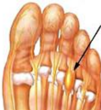
Рис. 1 – Локализация невromы

межпальцевом промежутке, между четвёртым и третьим пальцем [3].