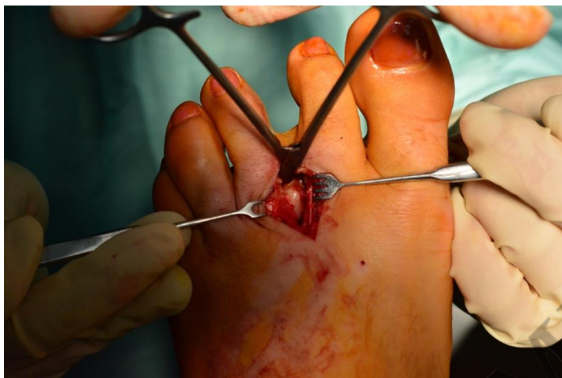
Рис. 4 – Тыльный доступ к невrome