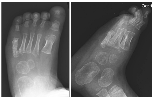
Рисунок 6. Отделенный рентгенологический результат через шесть месяцев после операции (А – прямая, Б – боковая проекции)

Послеоперационный период протекал без осложнений. Швы сняли на 14 сутки после операции. Гипсовая иммобилизация нижней конечности продолжалась на протяжении 6 недель с момента операции, до тех пор, пока рентгенологически не была диагностирована консолидация отломков плюсневых костей. После снятия лонгеты пациент проходил курсы лечебной физкультуры, массажа, гидрокинезиотерапии.