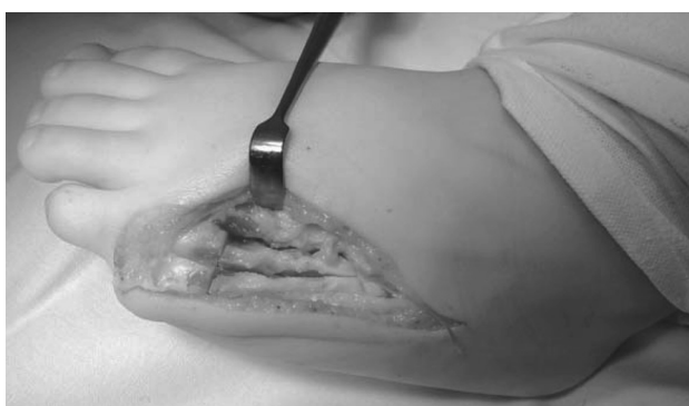
Рисунок 3. Техника выполнения остеотомии удвоенной плюсневой кости

выполнена продольная остеотомия конкресцированных V и VI плюсневых костей, а затем их поперечная остеотомия на одном уровне в области дистальных отделов диафизов костей, на несколько миллиметров проксимальнее зон роста. Проксимальный отдел V плюсневой и дистальный участок VI плюсневых костей были удалены. Следующим этапом медиализировали проксимальную часть VI плюсневой кости и выполнили адаптацию кортикальных слоев ее диафиза с таковыми же дистального отдела V плюсневой кости. Полноценной фиксации фрагментов плюсневых костей достигли путем их чрескостной фиксации спицами Киршнера. Гемостаз выполняли по ходу операции. На заключительном этапе, после рентгенологического контроля, выполнили послойный шов раны. Стопа была фиксирована задней гипсовой лонгетой от средней трети голени, до кончиков пальцев стопы.