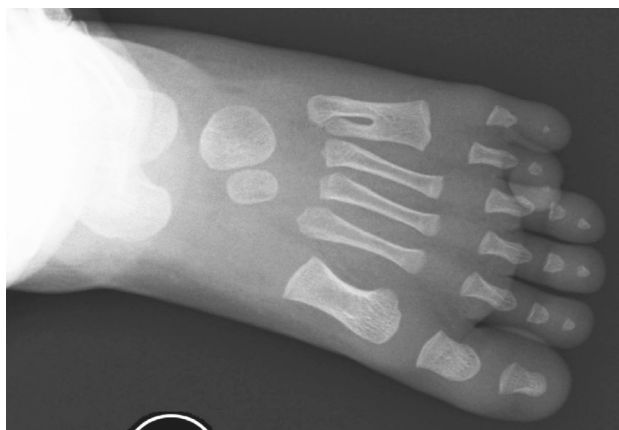
Рисунок 2. Первичное рентгенологическое исследование (прямая проекция)