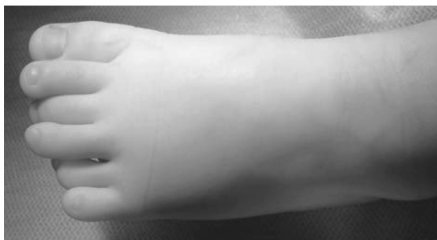
Рисунок 1. Вид стопы на момент поступления пациента в стационар

Хирургическое вмешательство. Под ларингеально-масочной анестезией было произведено регионарное обескровливание дистального отдела оперируемой конечности при помощи пневматической манжеты, фиксированной в области средней трети голени с созданием в ней давления до 300 мм рт. ст. Из дугообразного доступа в области тыльно-наружного отдела стопы произведено удаление гипоплазированного VI пальца. После чего