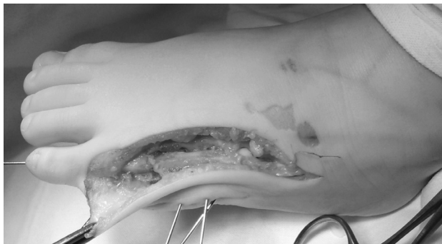
Рисунок 4. Формирование полноценного V луча стопы

выполнена продольная остеотомия конкресцированных V и VI плюсневых костей, а затем их поперечная остеотомия на одном уровне в области дистальных отделов диафизов костей, на несколько миллиметров проксимальнее зон роста. Проксимальный отдел V плюсневой и дистальный участок VI плюсневых костей были удалены. Следующим этапом медиализировали проксимальную часть VI плюсневой кости и выполнили адаптацию кортикальных слоев ее диафиза с таковыми же дистального отдела V плюсневой кости. Полноценной фиксации фрагментов плюсневых костей достигли путем их чрескостной фиксации спицами Киршнера. Гемостаз выполняли по ходу операции. На заключительном этапе, после рентгенологического контроля, выполнили послойный шов раны. Стопа была фиксирована задней гипсовой лонгетой от средней трети голени, до кончиков пальцев стопы.