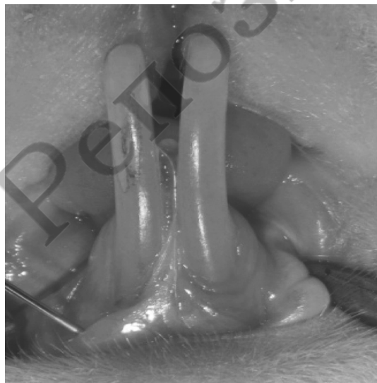
Рис. 2. Инъекция физиологического раствора в область экспериментальной рецессии десны на нижней челюсти

В качестве биodeградируемого носителя для введения инъекционным способом мезенхимальных стволовых клеток жировой ткани использовался Коллост® гель. Это стерильный гель для инъекций в шприцах, который содержит около 7 % коллагена нативного нереконструированного в 10 % стерильном растворе глюкозы.