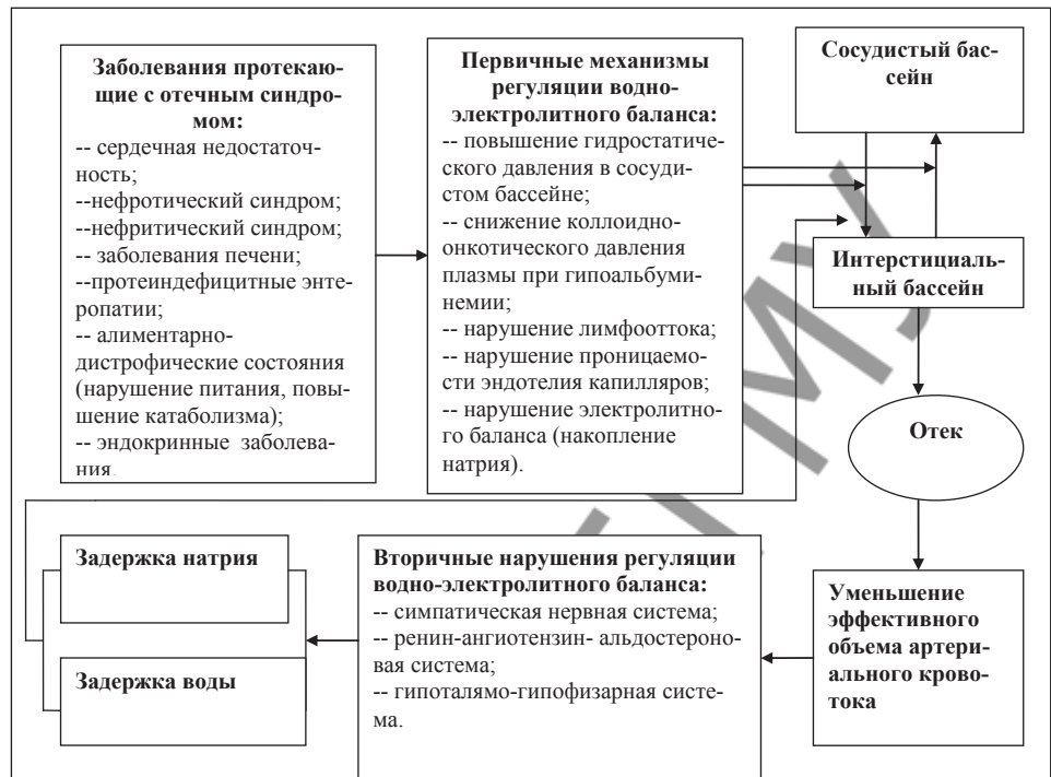
Рисунок 1. Схема патогенеза отечного синдрома при наиболее распространенных клинических ситуациях

реакции при нарушении водно-электролитного баланса представлены на схемах (рисунок 1; 2).