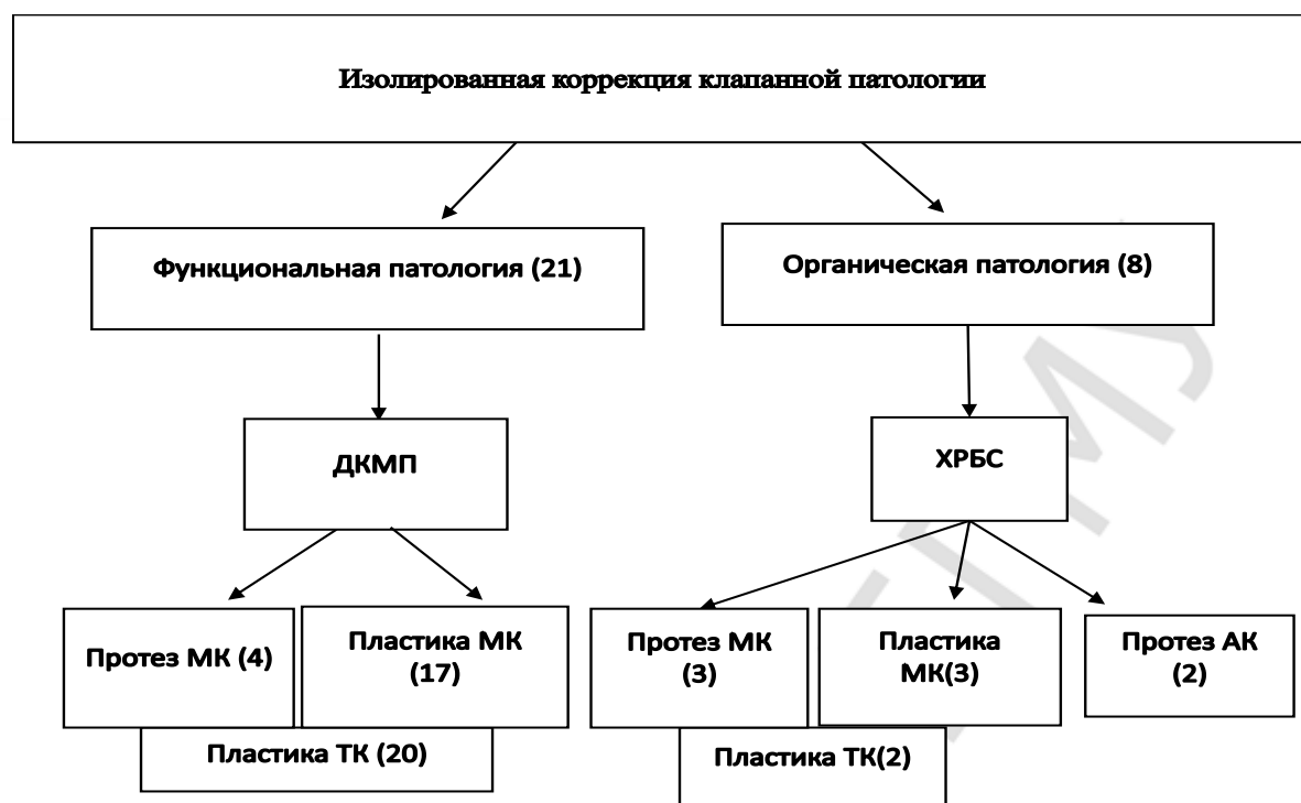
Рис. 1 – Спектр операций у пациентов с клапанной патологией

У 19 пациентов с ИБС выполнялся различный спектр хирургических вмешательств на открытом сердце (рисунок 2). У 7 пациентов после изолированного АКШ сроки выполнения трансплантации сердца после "хирургического моста" составили в среднем 2915(1438-2835) дней. У 12 пациентов после сочетанного АКШ + коррекция функциональной ишемической митральной недостаточности – 2000 (1386-2134) дней, что достоверно не отличалось от изолированной реваскуляризации миокарда ( p=0,543 ).