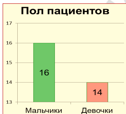
Рис. 1 – Половая структура пациентов

Из 30 обследованных пациентов было 16 мальчиков (53.33%) и 14 девочек (46.67%). Из них 5 детей дошкольного возраста (0-5 лет, 16,7%), 4 - младшего школьного возраста (6-11 лет, 13.3 %) и 21 пациент старшего школьного возраста (12-18 лет, 70%). Средний возраст пациентов составил 12.27 года (рисунки 1,2).