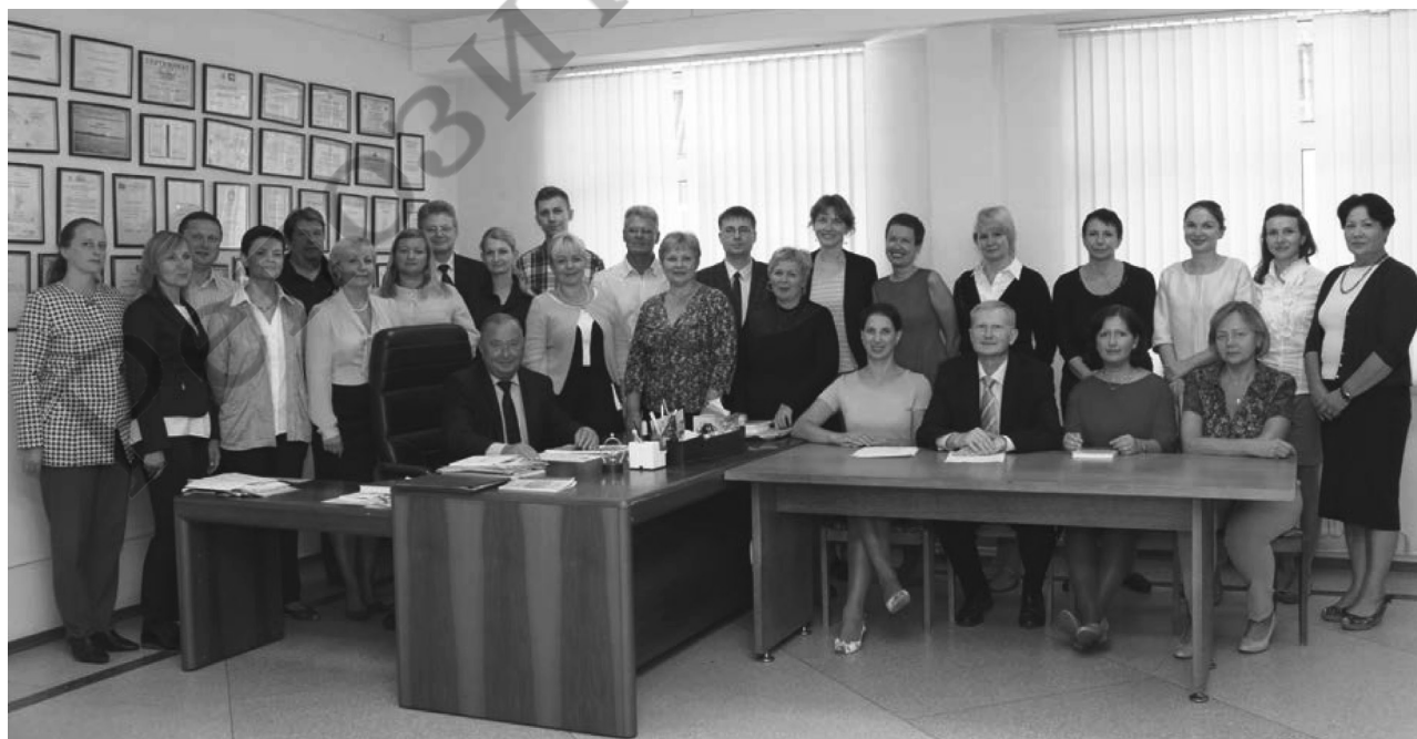
Коллектив 1-й кафедры детских болезней