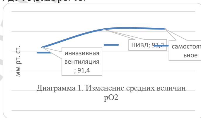
Рис.1 – Изменение средних величин pO_2

Результаты и их обсуждение. В исследовании была прослежена динамика данных по таким показателям как: pO_2 , pCO_2 и сатурации. По данным парциального давления кислорода в артериальной крови мы получили следующие результаты (рисунок 1), из которых видно, что с течение времени среднее значение показателя pO_2 возросло со значения 91,4 до 93,3мм рт. ст.