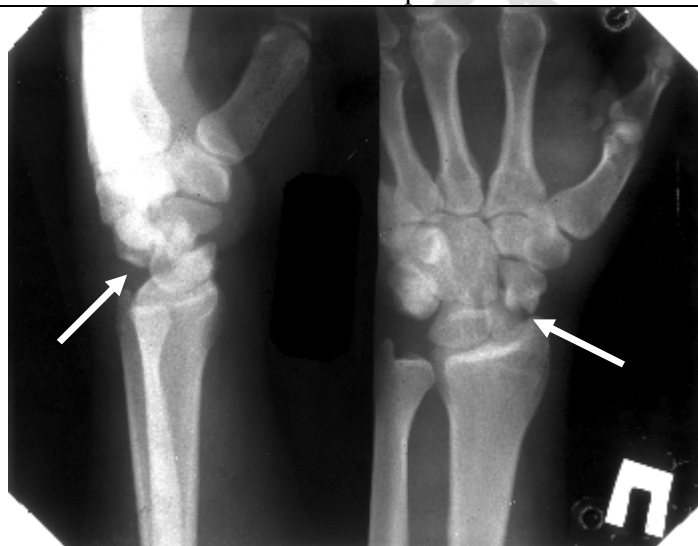
Рисунок 4. Рентгенограмма пациента К; Застарелый чрезладьевидный перилунарный вывих кисти

Переломы некоторых костей запястья со смещением отломков (наиболее часто – ладьевидной кости), остаточная углообразная деформация после сращения перелома дистального отдела лучевой кости на фоне дисторсии связок запястья, аваскулярный некроз костей запястья (чаще – полулунной кости) могут приводить к еще одной форме нестабильности – адаптивной запястью (адаптивному коллапсу запястья) , приводящему к своеобразному «складыванию» рядов запястья под углом друг к другу, снижению запястно-пястного коэффициента и резкому увеличению ладьевидно-полулунного угла (Рис.5. А, Б).