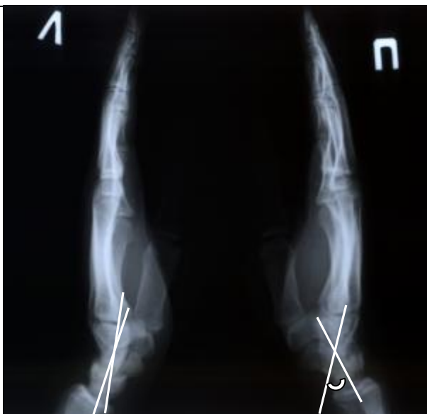
Рисунок 3. Рентгенограмма пациента Я. Увеличение головчато-полулунного угла при недиссоциированной нестабильности запястья справа