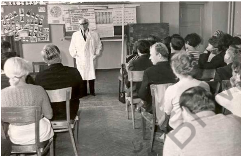
Академик В. А. Леонов на лекции в детском отделении 1-й клинической больницы г. Минска, 1969 г.

актуальными вопросами современной педиатрии и внедрением достижений науки в практику детского здравоохранения.