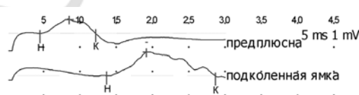
Рисунок 1. Пример изменений на ЭНМГ у пациента К. после трансплантации: амплитуда М-ответа при стимуляции в дистальной точке 0,603 мВ (норма 3–5 мВ). Резидуальная латентность 2,55 мс (норма 2 мс). Скорость на отрезке предплюсна–подколенная ямка 40,3 м/с. Норма скорости 40–60 м/с.

Результаты ЭНМГ. Всем пациентам с признаками полиневропатии выполнялась ЭНМГ. Типичной находкой на ЭНМГ явилось снижение амплитуды М-ответа, что указывает на аксональный характер полиневропатии у пациентов (рис.1).