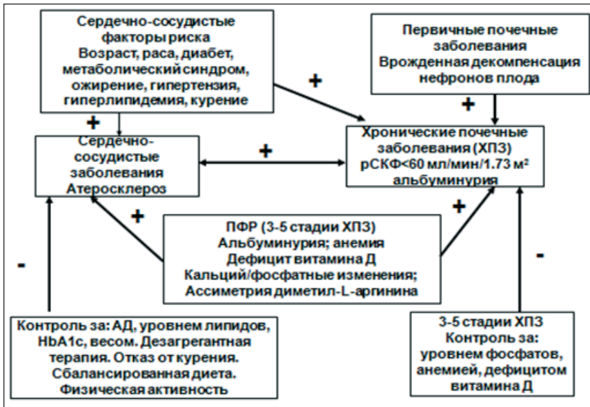
Рис. 2. Патофизиологические механизмы взаимодействия между сердечнососудистой системой и почками

потония, снижение СКФ и гиперкалиемию — основные осложнения, связанные с супрессией РААС. Существующие ранее истощение натрия и снижение СКФ являются наиболее важными факторами, влияющими на эти осложнения. Блокаторы альдостерона, в частности при добавлении к иАПФ или БАР, следует использовать с осторожностью при значении СКФ ниже 30 mL/min/1.73 м 2 . Тем не менее, каждый случай должен рассматриваться на индивидуальной основе с тщательной оценкой риска/пользы. Это означает, что у пациентов с установленным СС заболеванием, у которых повышен сердечно-сосудистый риск в связи с наличием ХПЗ, возможность использования блокады РААС, посредством ингибиторов АПФ, БАР, или ПИР в сочетании с