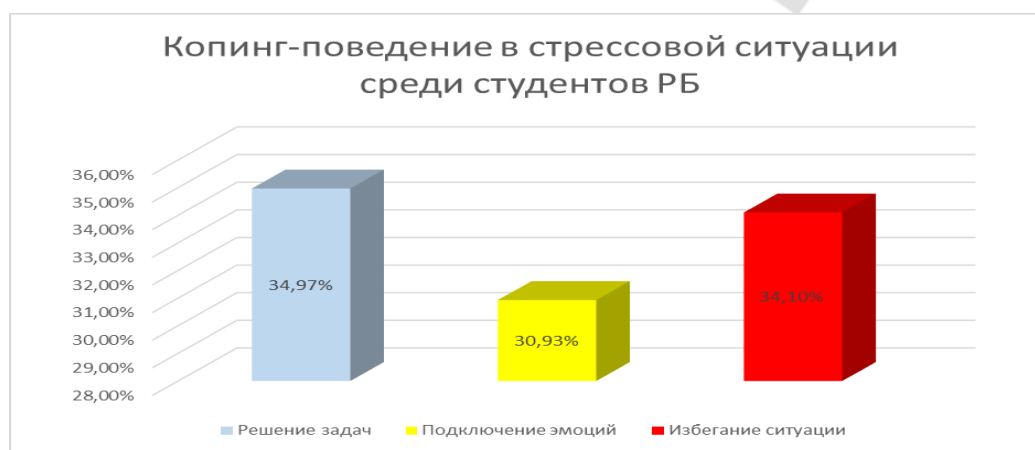
Диагр.4- Копинг-поведение в стрессовой ситуации среди студентов РБ

аций решается с помощью избегания (34,10%). Кроме того, примерно в трети случаев (30,93%) студент подключает эмоции, что существенно затрудняет переход к состоянию решения задачи. В зависимости от специфики происходящего человек двигается в определенном направлении относительно данной проблемы. Студенты 1-го курса лечебного факультета в большинстве ситуаций все же предпочитают решать задачу. Однако процент решения задач близится к трети от всех поступающих проблем. Это значит, что примерно в остальных 65-70% человек убегает от ситуации, подключая внутренние чувства, которые, судя по всему, в некоторые моменты берут верх над разумом и мешают в дальнейшей продуктивной деятельности. Кроме того, состояние, в котором обучающийся дает волю чрезмерному проявлению эмоций в ситуации, требующей решения, значительно затрудняет видение истинного корня проблемы, и вследствие этого человек практически в равной степени может как решить проблему, так и отложить ее на потом или и вовсе перестать об этом думать, отрицая возможные последствия.