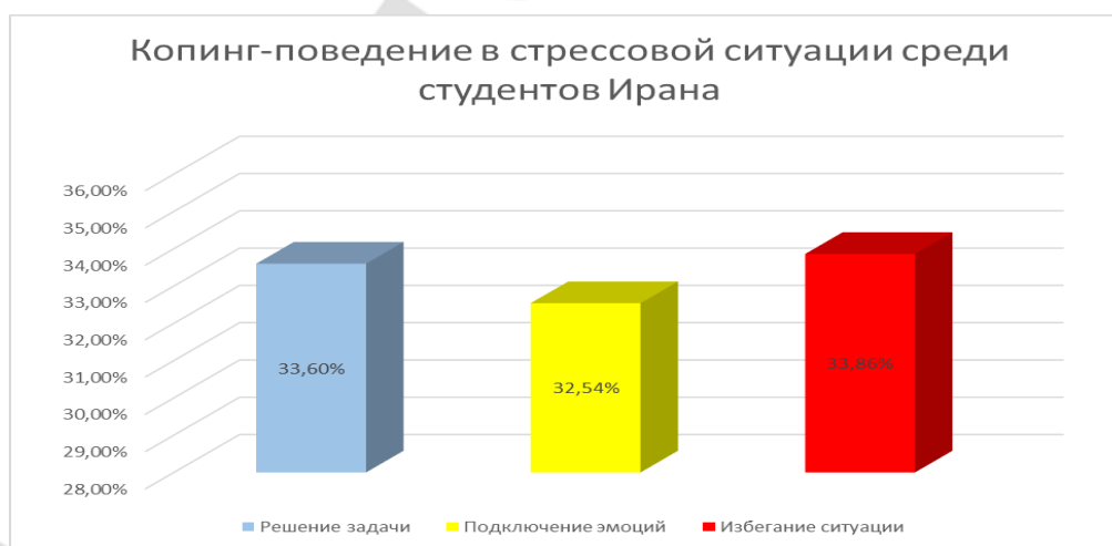
Диagr.6- Копинг-поведение в стрессовой ситуации среди студентов Ирана

По итогам опроса среди студентов Ирана все три пути отношения к поступающим задачам еще больше стремятся к равным показателям. Это снова говорит нам о том, что путь решения во многом может быть обусловлен самой ситуацией. На выбор определенной модели поведения человека в определенных обстоятельствах влияет множество факторов, таких как, например, внутреннее самовосприятие в данный момент, физическая составляющая индивида. Помимо выше перечисленного, на человека могут оказывать давление окружающие и исходя из всего этого он уже выберет окончательный путь решения проблемы, приемлемый для него в данных условиях. Преобладающей среди студентов Ирана является позиция избегания ситуации, что может быть связано с изменением обстановки, обучением на иностранном языке либо с какими-либо другими причинами.