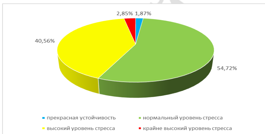
Диагр.1- Результаты теста на стрессоустойчивость среди студентов РБ

Тест «Анализ стиля жизни» среди студентов 1-го курса лечебного факультета и последующая обработка данных показали результаты, представленные в диаграмме 1.