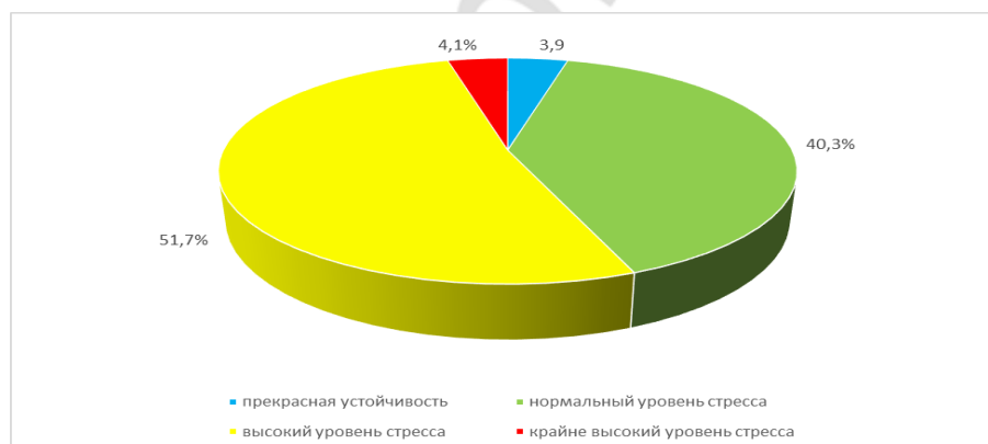
Диагр.3- Результаты теста на стрессоустойчивость среди студентов Ирана

Среди студентов 1-го курса из Ирана по сравнению со студентами лечебного факультета еще больше повышается процент людей с высоким уровнем стресса. В результате опроса были получены данные, представленные в диаграмме 3.