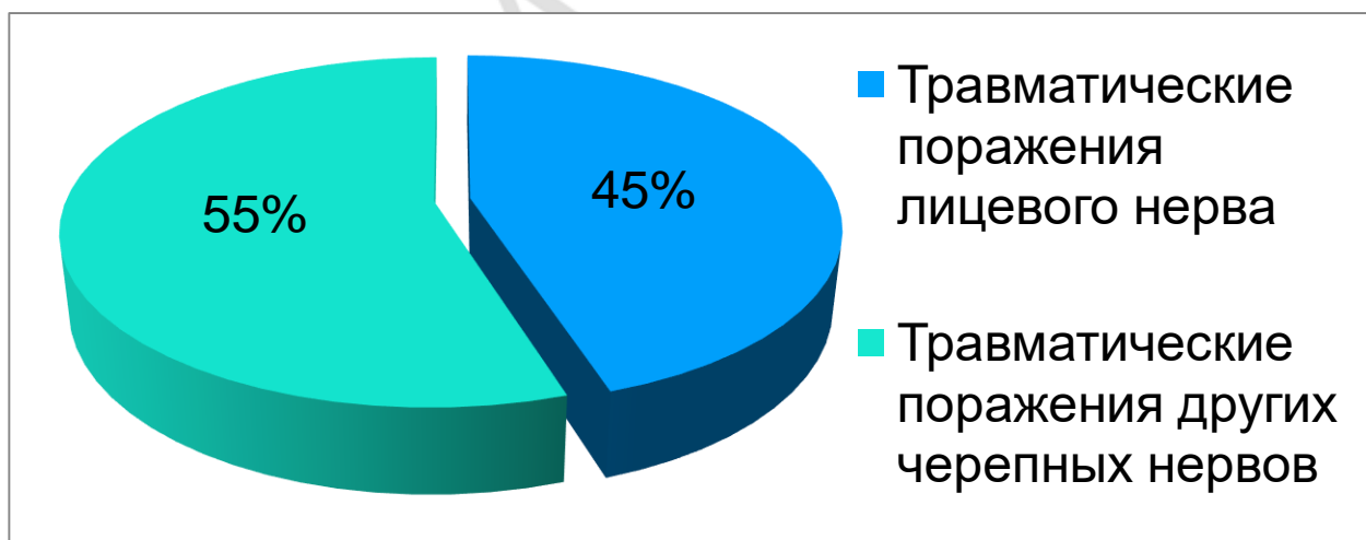
Рис. 1 – Частота травматических повреждений лицевого нерва

Актуальность. Травматические повреждения лицевого нерва достаточно часто являются ятрогенными [1], констатируются у 45% от общего числа поражений черепных нервов [3], что иллюстрирует рисунок 1. Пациенты с травматическим невритом лицевого нерва, развившимся в результате отологических операций, составляют 0,2-10%. Данный нерв оказывается поврежденным у 15% от общего числа лиц с черепно-мозговыми травмами и переломами основания черепа [4]. Лицевой нерв является смешанным [2].