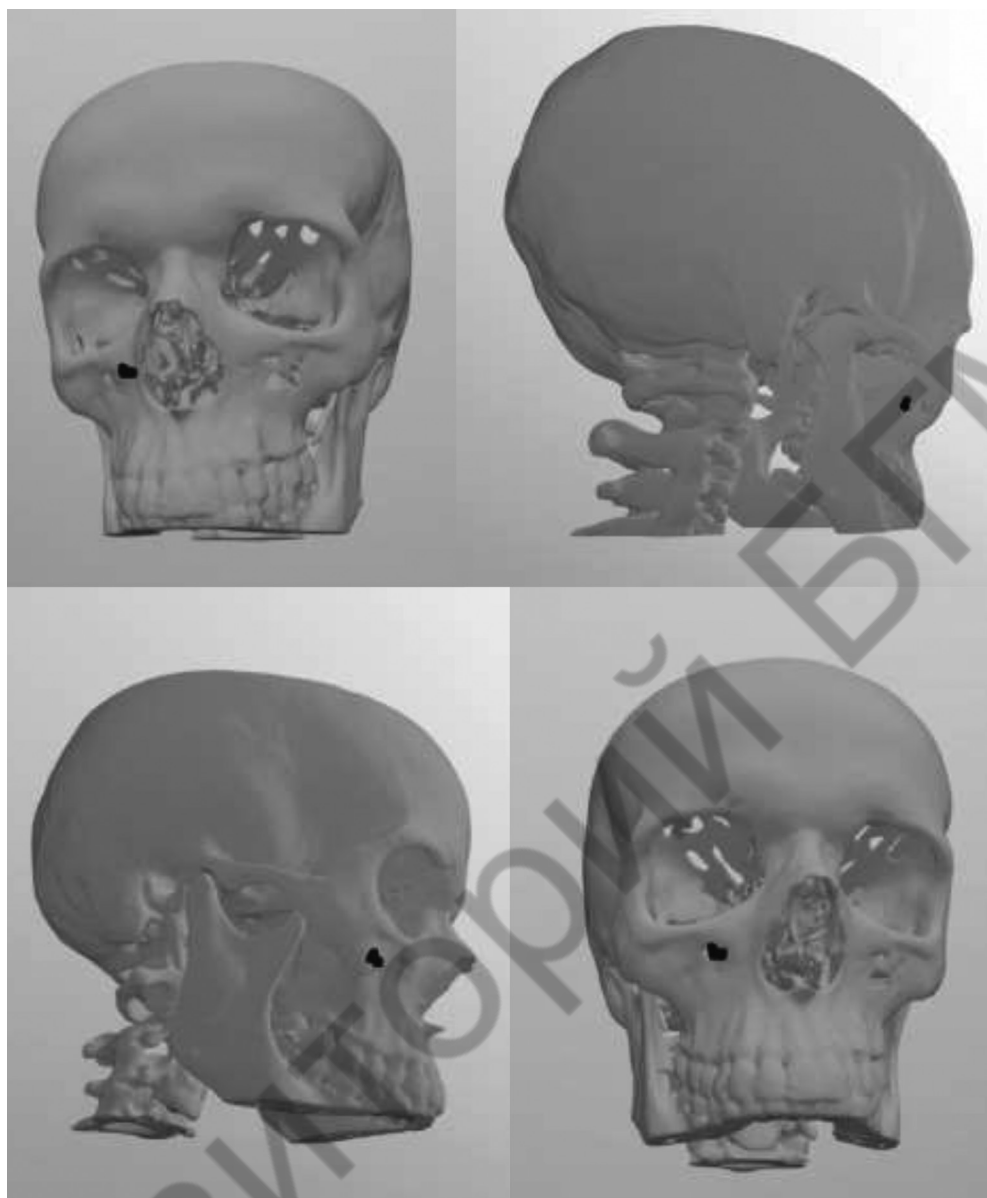
Рисунок 2. 3D модель головы пациента с инородным телом правой верхнечелюстной пазухи

конкретного пациента. Полученная информация позволяет нам уточнить локализацию патологического процесса, выбрать более оптимальный операционный доступ, минимизировать травматическое воздействие на окружающие ткани, уменьшить риск кровотечений и послеоперационных осложнений.