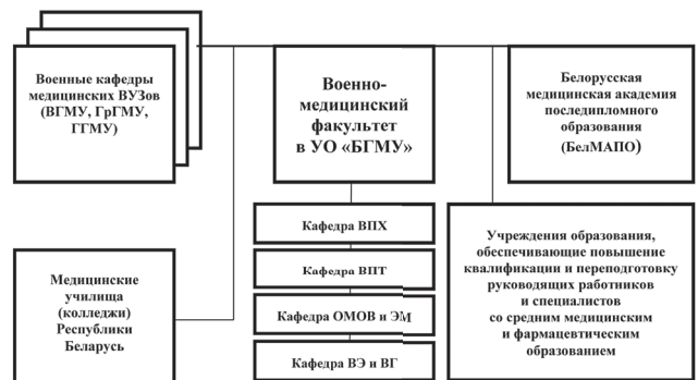
Рис.3. Образовательные учреждения в системе военно-медицинского образования Республики Беларусь

Таким образом, в формировании военного врача (офицера м/с) участвуют 62 кафедры Белорусского государственного медицинского университета и 4 кафедры ВМедФ.