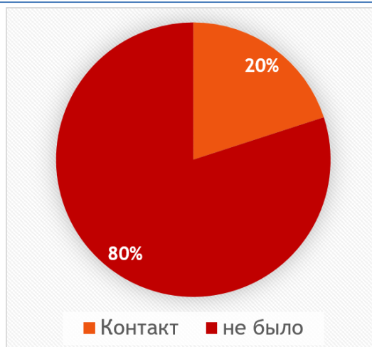
Рис. 1 – Установление контакта у пациентов

У большей части пациентов – 67 человек (83,7%) (95% ДИ 75,7-91,8) заболевание было выявлено при плановом флюорографическом обследовании, только у 13 (16,3%) (95% ДИ 8,2-24,3) при обращении к врачу с наличием жалоб.