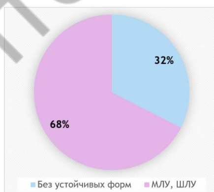
Рис. 2 – Распределение пациентов по устойчивости M. tuberculosis

Среди изученных пациентов лекарственно-чувствительный туберкулез (ЛЧ-ТБ) был установлен у 26 человек (32% случаев) (95% ДИ 22,2-42,8), у 54 пациентов (68%) (95% ДИ 57,2-77,8) имелась множественная лекарственная устойчивость (МЛУ) или широкая лекарственная устойчивость (ШЛУ) выделенного возбудителя (рис. 2).