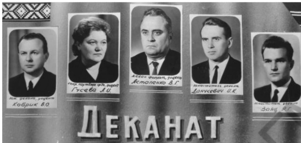
Фото 1. Должностные лица деканата лечебного факультета МГМИ 1979 г. Фото из выпускного альбома 1979 г.