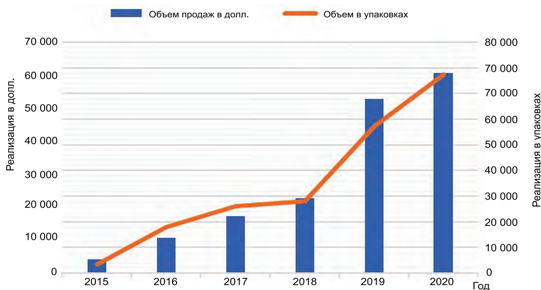
Рисунок 4 — Динамика продаж БАДов на основе травы кипрея узколистного в денежном и натуральном показателях за 2015–2020 гг.

С целью определения особенностей и тенденций потребления населением Республики Беларусь БАДов на основе травы кипрея узколистного нами проведен анализ показателей продаж в натуральных и денежных единицах за шесть лет (2015–2020 гг.). Результаты представлены на рисунке 4.