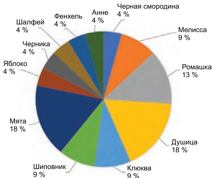
Рисунок 2 — Анализ поликомпонентных БАДов по составу на основе кипрея узколистного

Исследуемый ассортимент в 70,37 % представлен поликомпонентными биологически активными добавками. Структурный анализ ассортимента БАДов по компонентному составу показал, что преимущественно встречается кипрей в комплексе с мятой и душицей (по 18,0 %), и ромашкой (13,0 %) (рисунок 2).