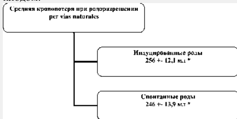
Рис. 3. Средняя кровопотеря при родоразрешении per vias naturales. * t = 0,5