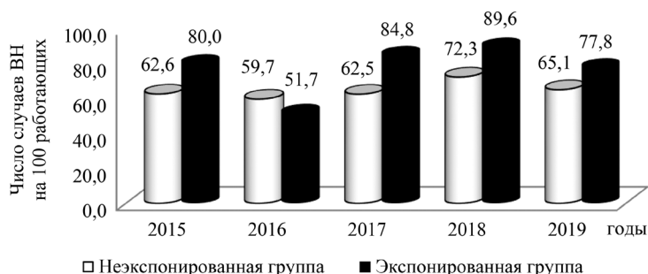
Рисунок 1. Динамика числа случаев временной нетрудоспособности в исследуемых группах за 2015–2019 гг.

В последующие два года наблюдался подъем числа случаев на 4,7 % и на 15,7 %. В 2019 году произошло снижение числа случаев на 10,0 % по сравнению с показателем 2018 года.