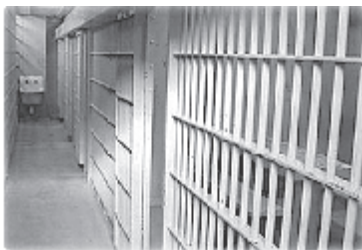
Рис. 4. Тюрьма г. Минска, где находился Г. Фалевич