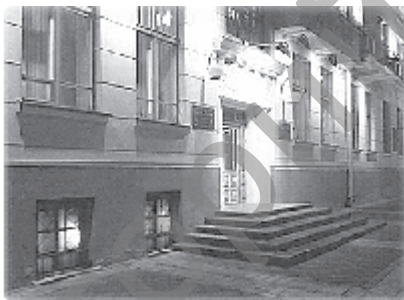
Рис. 3. Аптека № 1 г. Минска по ул. Советской, 17