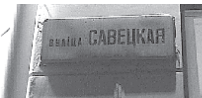
Рис. 2. ул. Советская 17