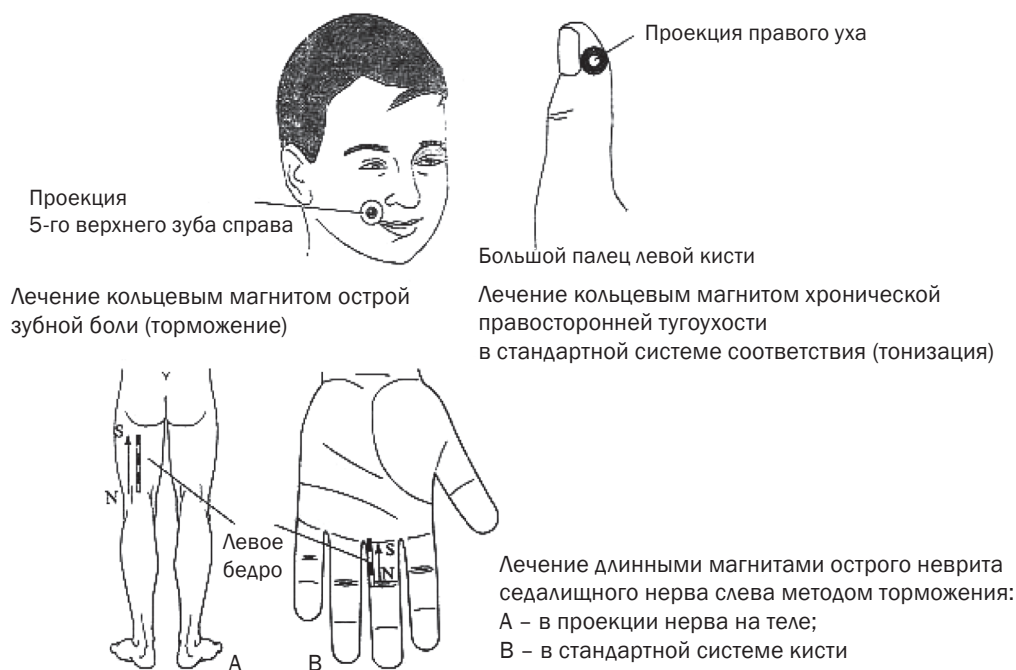
Рис. 1, 2

Профессор Пак Чжэ Ву обнаружил, что при отклонениях от нормы в органах и частях тела при заболеваниях и болезненных состояниях появляются болезненные точки и зоны соответствия. Если их найти и простимулировать, оказав на них воздействие, то происходит нормализующее влияние на больной орган или часть тела. В теле человека происходит нормализация