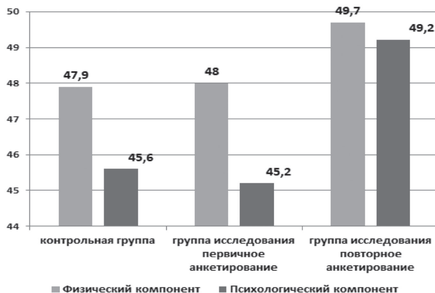
Рисунок 2. Совокупные показатели анкетирования всех групп с применением опросника MOS SF-36

Различия остальных показателей были установлены на уровне тенденции ( p = 0,055 «Физическая работоспособность, RF») либо отсутствовали ( p > 0,05 ).