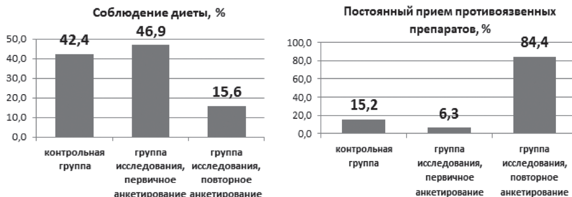
Рисунок 4. Средние значения показателей анкетирования с использованием шкалы Visick по указанным критериям (1)

При этом, хорошие послеоперационные результаты отмечались в группе исследования