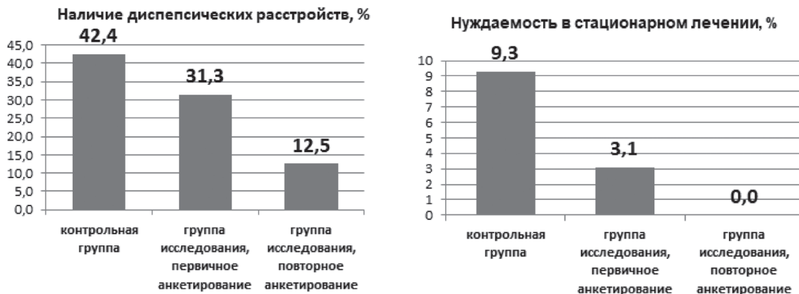
Рисунок 5. Средние значения показателей анкетирования с использованием шкалы Visick по указанным критериям (2)