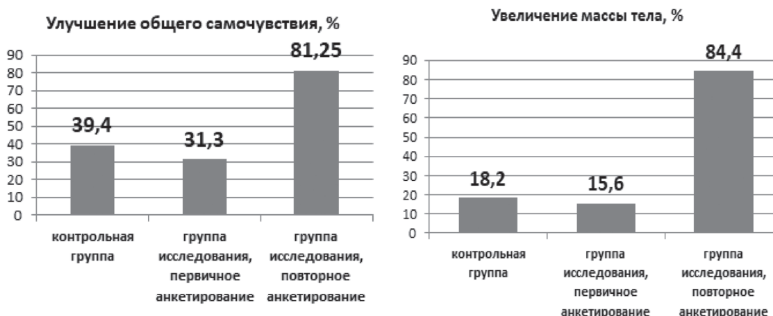
Рисунок 6. Средние значения показателей анкетирования с использованием шкалы Visick по указанным критериям (3)

после первичного анкетирования у 15,6% (при 84,4% удовлетворительных), соответственно, после повторного – 78,1 и 21,9% (в сравнении в контрольной группой – 18,2 и 81,8%) ( \chi^2 = 23,6 , p = 0,00007 ).