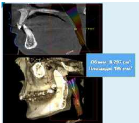
Рис. 2 – До ортодонтического лечения