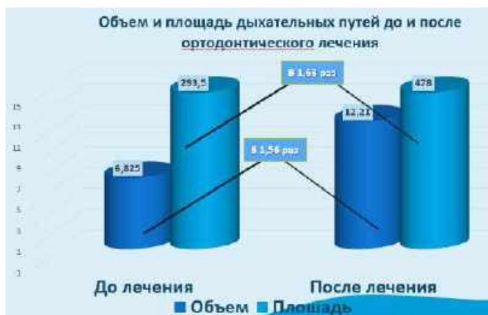
Диagr. 1 – Результаты исследования

Выводы: установлено динамическое сужение верхних дыхательных путей у пациентов с зубочелюстными аномалиями, проявляющиеся достоверным уменьшением общего объема дыхательных путей в 1,6 раза ( p < 0,01 ) и площади поперечного сечения в 1,4 раза ( p < 0,05 ). Установленные обструкционные изменения приводят к деформации формы ротоглотки и расположению минимальной площади поперечного сечения в нижней области ротоглотки (в 70% случаев), что увеличивает склонность к коллапсу верхних дыхательных путей.