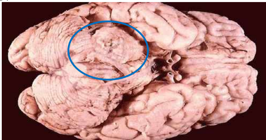
Рис. 3 – Макроскопическое строение опухоли

При микроскопическом исследовании клетки опухоли в поздних стадиях формировали группы с вытянутыми ядрами по типу палисад.