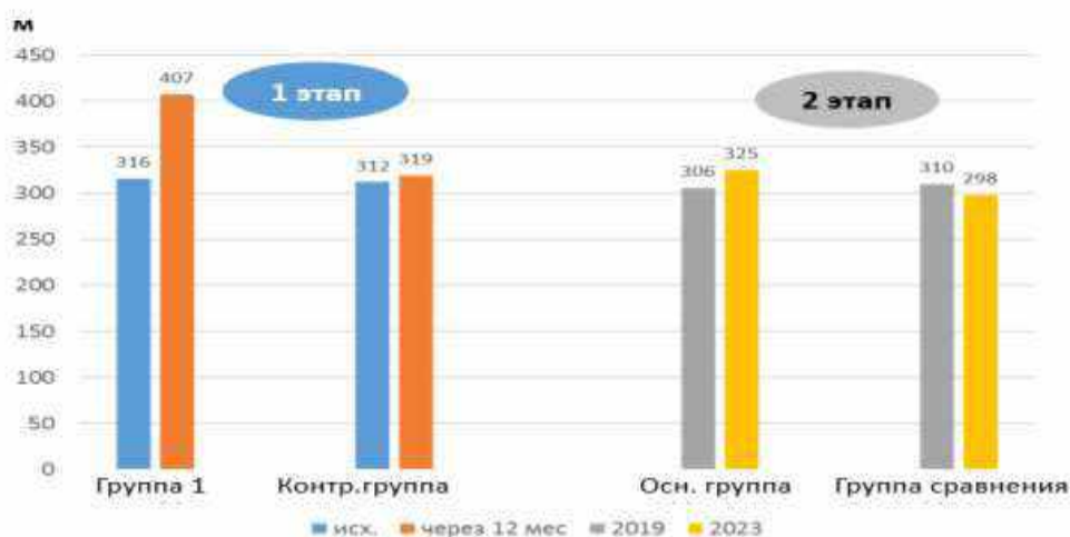
Рис. 1 – Динамика показателя теста 6-минутной ходьбы