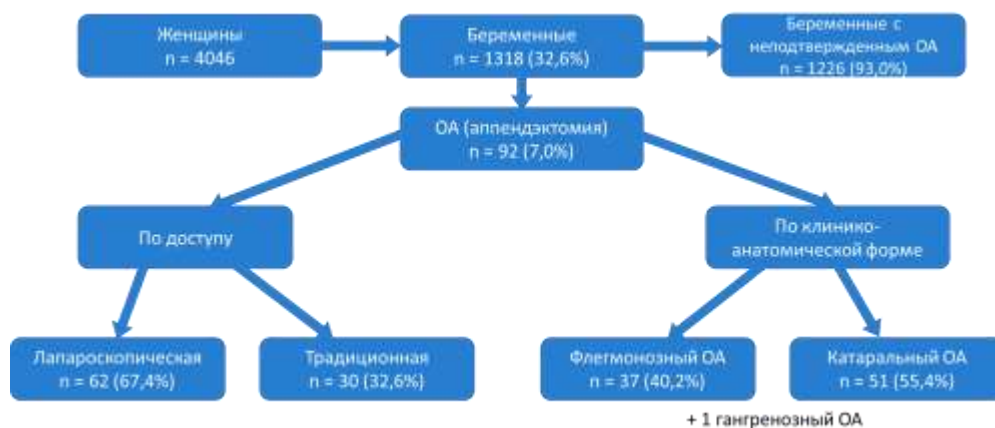
Рис. 1 – Схема деления всей выборки на группы

Проведен анализ современной литературы по вопросу диагностики ОА и тактики ведения беременных с ОА [2, 3].