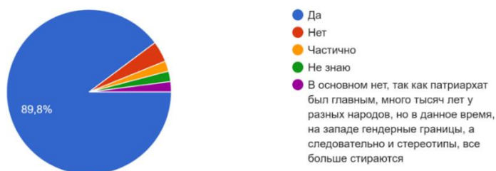
Рисунок 1. Результаты ответа на вопрос «Разнятся ли, на Ваш взгляд, гендерные стереотипы у представителей разных культур и национальностей?»

Разнятся ли, на Ваш взгляд, гендерные стереотипы у представителей разных культур и национальностей? 49 ответов