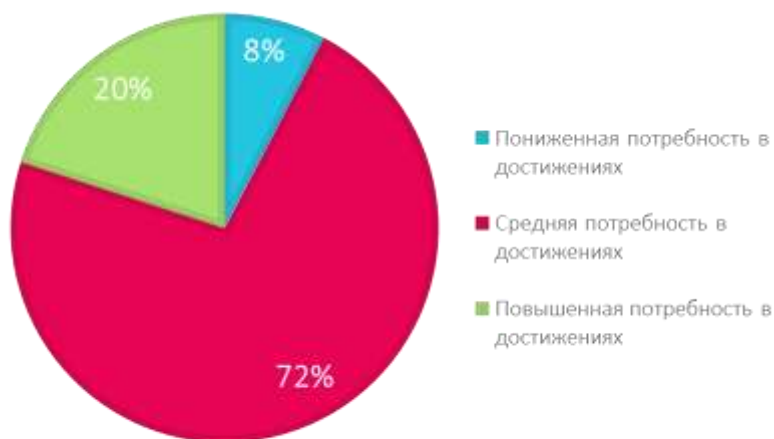
Рис. 1 – Результаты анкетирования студентов-медиков по методике Ю. М. Орлова (тест-опросник «Потребность в достижении цели. Шкала оценки потребности в достижении успеха»)

Результаты и их обсуждение. Пониженный уровень потребности в достижении успеха выявлен у 7,69 % (10 чел.) студентов-медиков. Средний уровень и повышенный уровень потребности в достижении успеха определяется у 72,31 % (94 чел.) и 20,0 % (26 чел.) соответственно (рисунок 1).