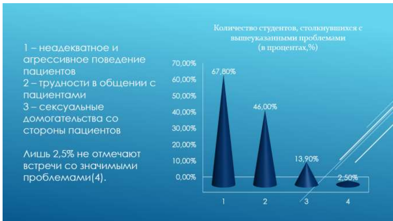
Рис. 1 – Основные проблемы, с которыми столкнулись студенты во время своей работы

Результаты и их обсуждение. Среди опрошенных официально трудоустроены 82,2% (при этом 65,8% работают медицинской сестрой), волонтеры 17,8%. Большинство студентов пошли работать в лечебные учреждения в целях оказания посильной помощи органам здравоохранения и совершенствования своей профессиональной подготовки.