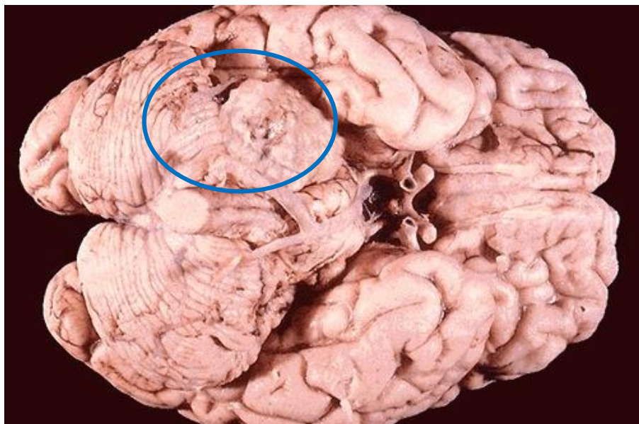
Рис. 3 – Макроскопическое строение опухоли

При микроскопическом исследовании клетки опухоли в поздних стадиях формировали группы с вытянутыми ядрами по типу палисад.