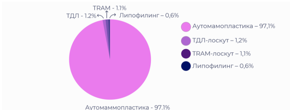
Диagr. 1 – Реконструкции с использованием собственных тканей

Все реконструктивно-пластические вмешательства после мастэктомии можно разделить на три группы: реконструкция с использованием собственных тканей (59,4%), искусственных материалов (36,6%) и их комбинации (7,0%). К первой группе относились операции с использованием аутотрансплантатов в виде кожно-жировых лоскутов из самой железы, которые формируют 97,1% случаев реконструкций с использованием только собственных тканей. Кроме того, в эту группу входили случаи применения торакодорсального лоскута (ТДЛ) (1,2%), перемещенного лоскута на прямых мышцах живота (TRAM-лоскута) (1,1%) и использование свободной аутотрансплантации жировых клеток, взятых из других анатомических областей – липофилинг (0,6%) (диаграмма 1).