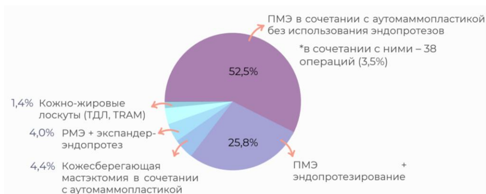
Диagr. 4 – Методы реконструкции молочной железы после мастэктомии

изолированная реконструкция только силиконовым имплантатом после выполненной ПМЭ – 281 операция (25,8%). Менее приоритетным методом оказалась кожесберегающая мастэктомия с удалением САК в сочетании с аутомаммопластикой – 48 операций (4,4%). Следующее место по частоте занял двухэтапный метод реконструктивно-пластических операций после РМЭ с использованием экспандера-импланта – 44 операции (4,0%). Реже проводились изолированные реконструкции с помощью только лишь кожно-жировых лоскутов (ТДЛ, TRAM) (1,4%) (диаграмма 4).