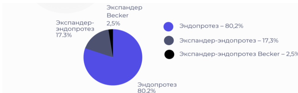
Диагр. 2 – Реконструкции с использованием искусственных материалов

двухэтапные операции с первичной дермотензией экспандером и последующей заменой на эндопротез, которые составили 17,3%. Экспандер-имплант типа Becker использовался в 2,5 % случаев (диаграмма 2).