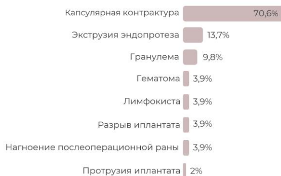
Диagr. 5 – Структура ранних послеоперационных осложнений при эндопротезировании

Ранние послеоперационные осложнения при изолированном эндопротезировании после ПМЭ или кожесохраняющей мастэктомии отмечены в 15,9% случаев (51), среди них: капсулярная контрактура – 70,6%, расхождение краев послеоперационной раны и экструзия эндопротеза – 13,7%, возникновение гранулемы – 9,8%, гематомы – 3,9%, лимфокисты – 3,9%, нагноение послеоперационной раны – 3,9%, протрузия эндопротеза – 2%, а также осложнения, связанные с самими имплантатами, такие как разрывы импланта – 3,9% (диаграмма 5).