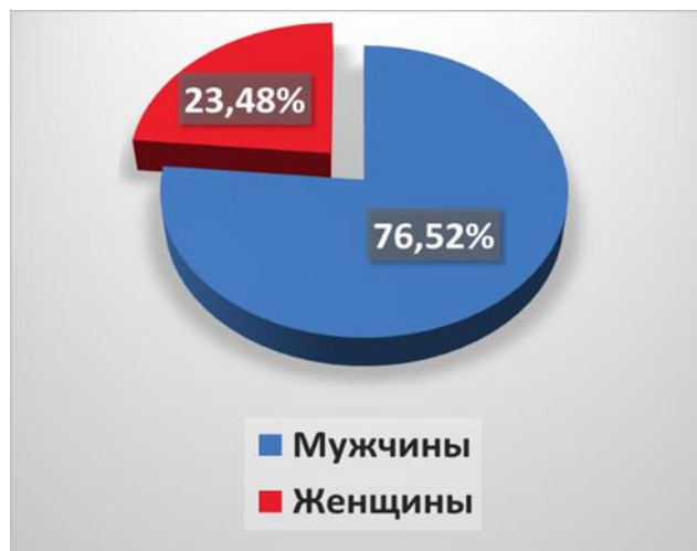
Рис. 1 – Распределение пациентов по полу

Средний возраст на момент первой имплантации составил 59 \pm 12,5 лет. В ходе исследования выяснилось, что до 2008 года, а именно в период 2001-2007гг., пациентам, проанализированным в исследовании, было имплантировано 27 устройств. Всего было имплантировано 1211 ИКД/CRT-D/CRT-P (Рис.2): впервые 75,97% (920), второй раз 21,1% (255), третий – 2,73 % (33), четвертый – 0,165% (2), пятый- 0,08% (1).