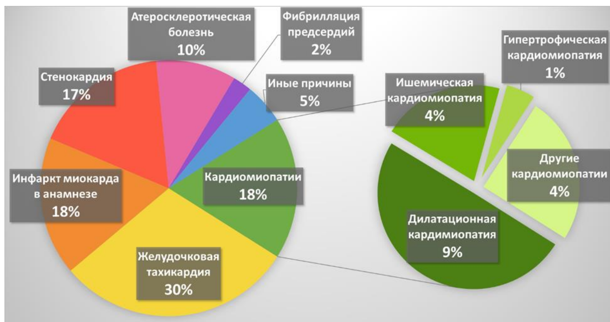
Рис. 3 – Показания к имплантации устройств пациентам, проанализированным в исследовании