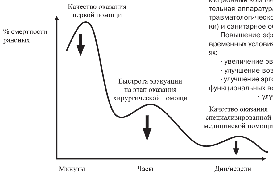
Рис. 1. Зависимость смертности раненых от качества оказания первой помощи, скорости эвакуации и качества оказания специализированной медицинской помощи

Следующим важным показателем является время, в течение которого раненый будет доставлен на этап медицинской эвакуации для оказания соответствующей хирургической помощи. Квалификация медицинского персонала, оснащение медицинским имуществом, возможности по проведению функциональных, инструментальных и лабораторных методов исследования данного этапа также играют