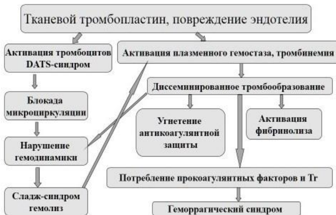
Рисунок 2 – Схема патогенеза синдрома ДВС

Согласно патофизиологии выделяют четыре основных варианта синдрома ДВС на основании доминирующего признака: