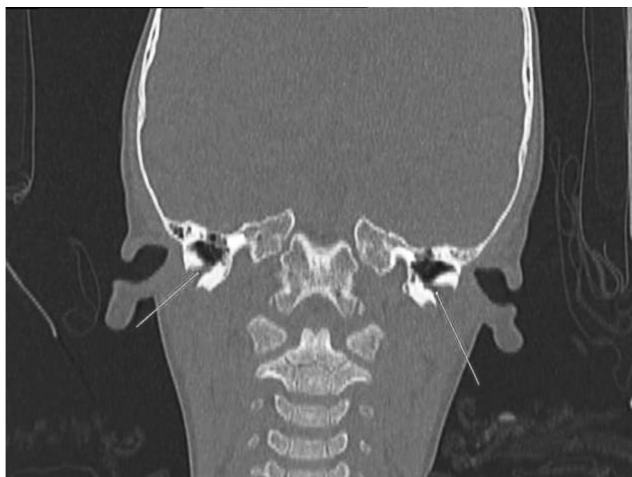
Рисунок 2. КТ пациента К., барабанные отверстия (отверстия Хушке) указаны стрелками

логлоточном пространстве справа. Шейная лимфаденопатия, вероятнее, реактивного характера. Также по результатам КТ описаны с обеих сторон костные дефекты, соединяющие наружный слуховой проход и височно-нижнечелюстной сустав, размерами 2 мм справа и 3 мм слева – барабанное отверстие (отверстие Хушке); данное отверстие справа ранее служило путем оттока гноя (рисунки 2–4).