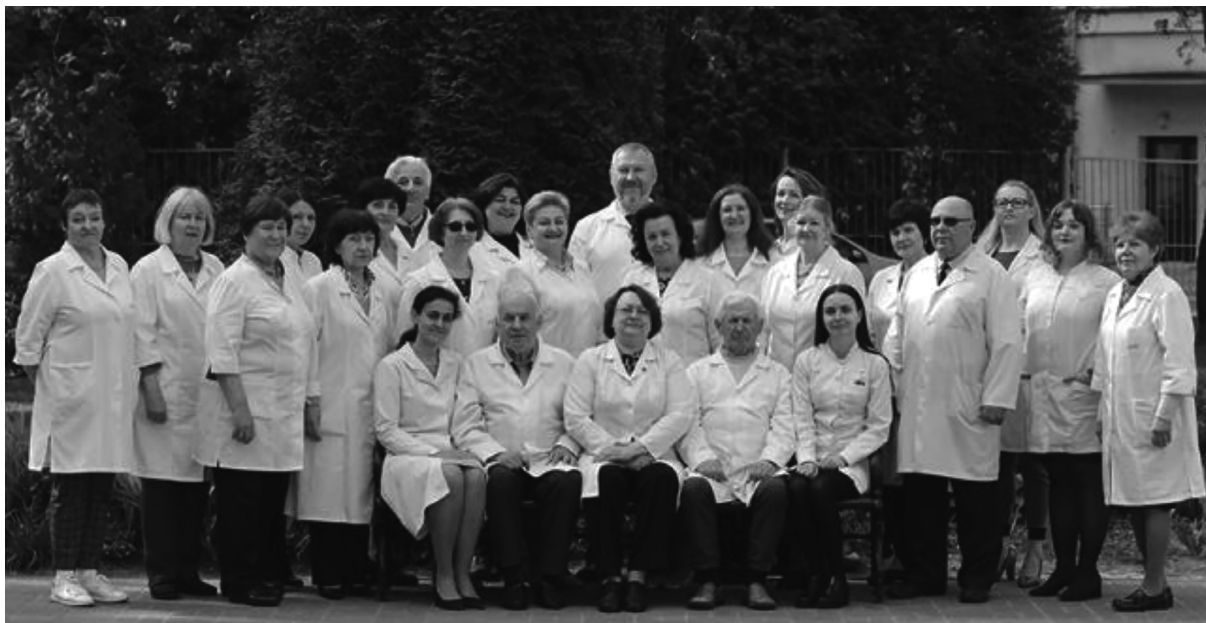
Коллектив кафедры общественного здоровья и здравоохранения (2022).