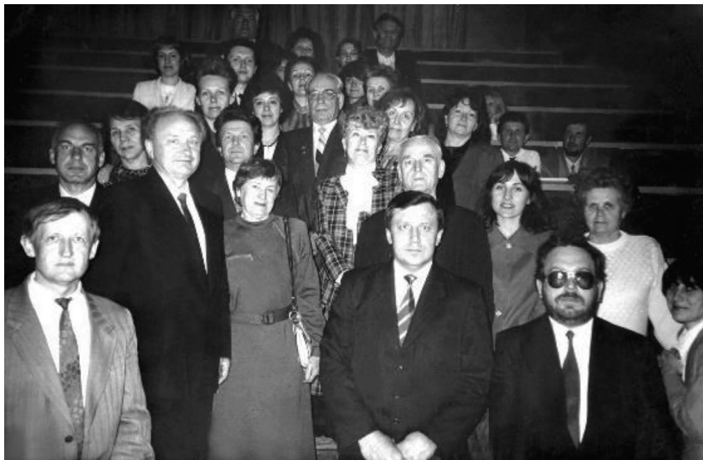
Участники 7-й научной конференции по истории медицины (1995)