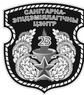
Геральдический знак ГУ «23 СЭЦ ВС РБ». 2006г.

Геральдический знак, как эмблема 23 СЭЦ ВС РБ, представляет собой изображение дубового венка (символа стойкости) золотого цвета, обвитого двумя змеями, – стилизованное изображение длиннейшего полоза (эскулапова змея). Одна из змей символизирует гигиену, вторая – эпидемиологию. Головы змей склонены над чашей с огнем, символизиру-