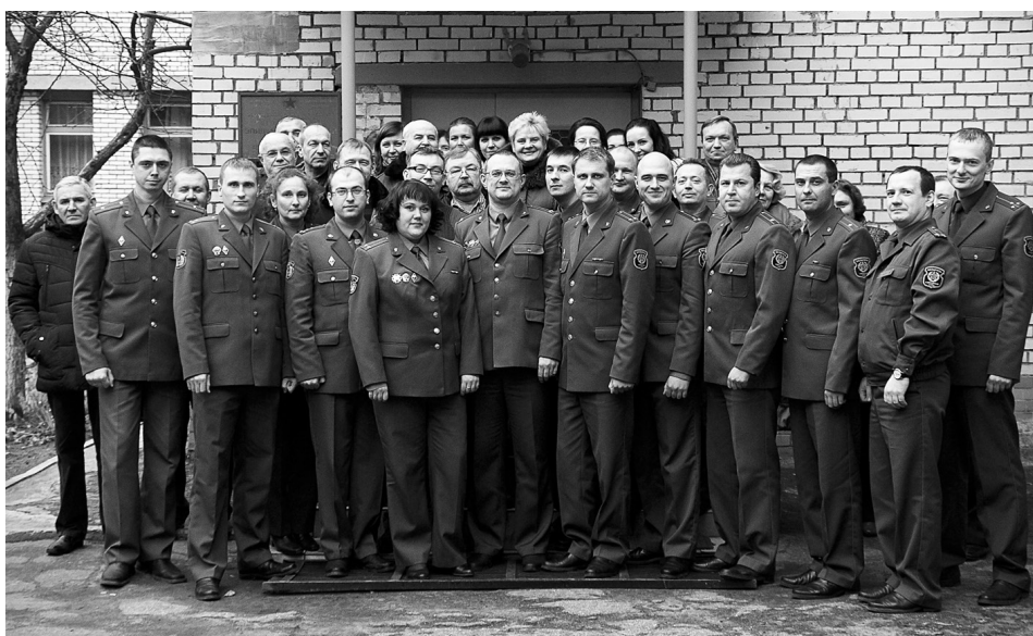
Коллектив государственного учреждения «23 санитарно-эпидемиологический центр Вооруженных Сил Республики Беларусь». 2013 г.

Сегодня специалисты центра – это коллектив единомышленников и профессионалов, который успешно выполняет стоящие перед ним задачи по поддержанию санитарно-эпидемиологического благополучия среди военнослужащих и гражданского персонала Вооруженных Сил Республики Беларусь, выявлению неблагоприятных факторов среды обитания и учебно-боевой деятельности войск, недопущению возникновения и распространения в воинских коллективах инфекционных заболеваний и отравлений.