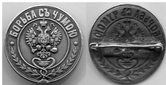
Знак для должностных лиц за борьбу с чумой. Неизвестная мастерская. Серебро. Диаметр 39,5 мм. Вес 16,57 г. ПБ, I, № 5.5а

С 2006 г. 23 СЭЦ ВС РБ имеет свой геральдический знак. Основой для его создания послужила царская медаль, учрежденная 21 июня 1897 г. с официальным названием «Знак для должностных лиц, отличившихся в борьбе с чумой» 1 . Этим знаком награждались санитарные врачи в период печально известной русско-японской войны 1904–1905 гг. и Первой мировой войны 1914–1918 гг. Медаль изготавливалась из серебра и бронзы и носилась на верхней одежде, на красной ленте (для христиан) и зелёной (для мусульман).