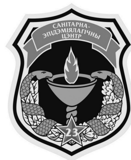
Геральдический знак ГУ «23 СЭЦ ВС РБ». 2018г.

ющей наиболее радикальный и эффективный способ борьбы с инфекционными заболеваниями. В основу этого положены слова древнегреческого врача и философа Гиппократ: «Что не лечится огнем, не лечится ничем» 2 .